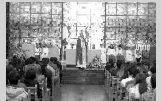
Celebração da Crisma na Igreja Matriz