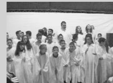
Primeira Eucaristia na Comunidade Rural Córrego Dantas