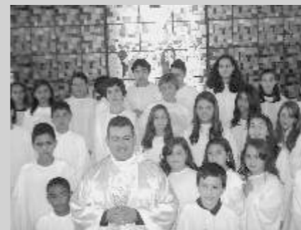
Primeira Eucaristia na Igreja Matriz de São Sebastião

Mais uma etapa de formação foi concluída pela Catequese em nossa paróquia, com a celebração da Primeira Eucaristia de 24 crianças na Comunidade Rural do Córrego Dantas, 4 na Fazenda Cachoeirinha, 13 na Fazenda Matão, 25 na Comunidade Maria Imaculada, 21 na Comunidade Santo Expedito, e 130 na Igreja Matriz de São Sebastião, e da Crisma de 150 jovens.